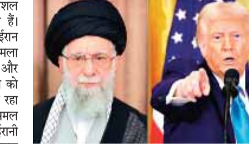
आयतुल्लाह खामेनेई, डोनाल्ड ट्रंप

हालांकि, राष्ट्रपति ट्रंप का कहना है कि वह ईरान के खिलाफ मिलिट्री कार्रवाई से बचना चाहते हैं। उन्होंने कहा है कि वह ईरान से बात कर रहे हैं। उन्होंने मिलिट्री ऑपरेशन से बचने की संभावना को खूना रखा, जबकि पहले वेतावनी दी थी कि तेहरान के लिए समय खत्म हो रहा है। क्योंकि अमेरिका इस क्षेत्र में एक बड़ा नौसैनिक बेड़ा भेज रहा है। ट्रंप ने कहा कि मैंने ईरान से बात करने की भी योजना बनाई है। हमने एक समूह को ईरान भेजा है। उम्मीद है कि हमें सैन्य कार्रवाई का इस्तेमाल नहीं करना पड़ेगा।