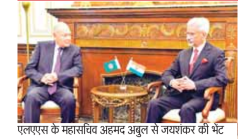
एलएएस के महासचिव अहमद अबुल से जयशंकर की भेंट

भारत-अरब देशों के विदेश मंत्रियों की दूसरी बैठक (आईएसएफएमएम) आज 31 जनवरी को होगी। बैठक वाले दिन अरब देशों के विदेश मंत्री सुबह करीब 11 बजे प्रधानमंत्री नरेंद्र मोदी के साथ संयुक्त रूप से शिफ्टवार मेट करेंगे और उसके बाद उनकी औपचारिक बैठक की शुरुआत होगी। जिसकी अध्यक्षता भारत के विदेश मंत्री डॉ. एस. जयशंकर करेंगे। इस वर्ष एक दशक के बाद यह बैठक हो रही है। पूर्व में इसका आयोजन वर्ष 2016 में बहरीन में किया गया था। बतौर पहली बैठक समूह के विदेश मंत्रियों ने सहयोग से जुड़े प्राथमिकता वाले पांच क्षेत्रों का चयन किया था। जिसमें ऊर्जा, अर्थव्यवस्था, शिक्षा, मीडिया और संस्कृति मुख्य थे।