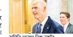
समिति अध्यक्ष रिक स्कॉट

अमेरिकी सांसदों ने एक बार फिर मांग उठाई है कि दवाओं पर स्पष्ट रूप से यह दर्ज किया जाए कि उनका निर्माण किस देश में हुआ है। उनका कहना है कि कोविड-19 महामारी के दौरान भारत सहित कई देशों द्वारा दवाओं और उनके कच्चे माल के निर्यात पर लगाए गए प्रतिबंधों ने यह उजागर कर दिया कि अमेरिका की दवा आपूर्ति श्रृंखला अब भी बड़े पैमाने पर विदेशी देशों पर निर्भर है और इससे राष्ट्रीय स्वास्थ्य सुरक्षा को गंभीर जोखिम हो सकता है। यह मांग अमेरिकी सीनेट की एजिंग पर बनी विशेष समिति की