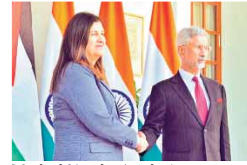
फिलिस्तीन की विदेश मंत्री वारसेन शाहीन और एस. जयशंकर

जयशंकर ने फिलिस्तीन की विदेश मंत्री और प्रवाची मंत्री वारसेन अगाबेकियाण शाहीन से मुलाकात की। इस दौरान दोनों नेताओं ने विकास सहयोग, गाजा शांति योजना और क्षेत्रीय विकास पर चर्चा की। विदेश मंत्री ने एक्स पर लिखा कि फिलिस्तीन के विदेश मंत्री वारसेन अगाबेकियाण से मिलकर खुशी हुई। गाजा पीस प्लान और इलाके के विकास पर विचारों का आदान-प्रदान किया। हमारे विकास सहयोग की समीक्षा की और इसे आगे बढ़ाने के लिए पहलों पर सहमति जताई।